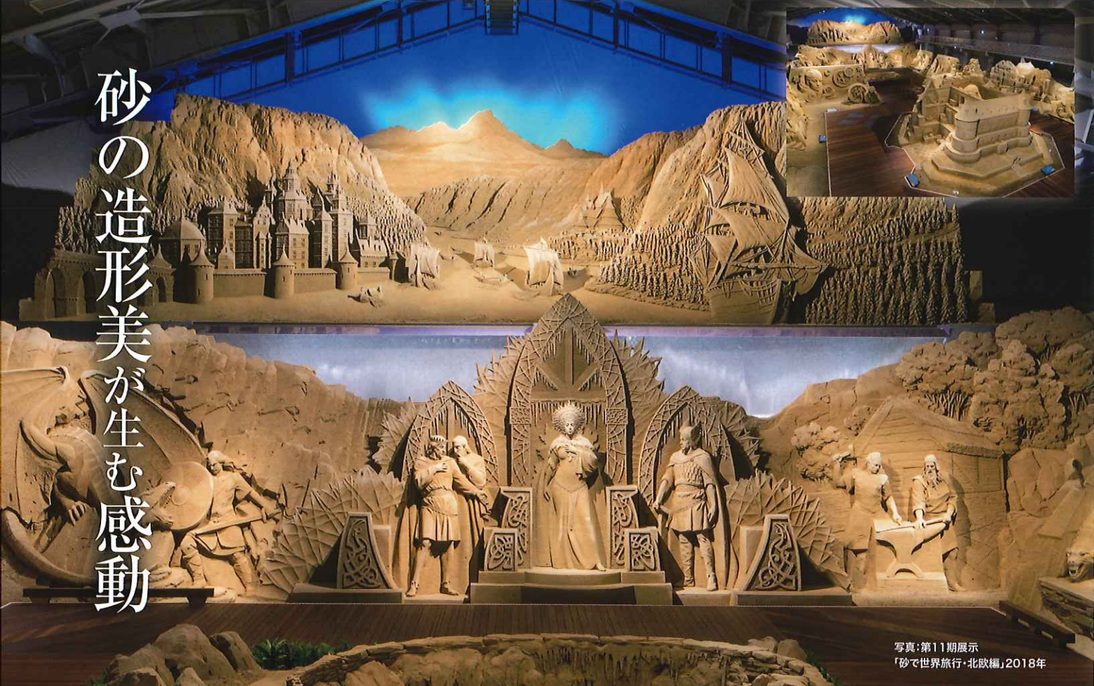
写真：第11期展示 「砂で世界旅行・北欧編」2018年

砂の美術館は砂像彫刻を専門に展示する世界で唯一の美術館です。2006年に砂像の展示をスタートさせて以来、毎年テーマを変えて世界トップクラスの彫刻家が繊細で存在感のある作品を創り出し、多くの来場者に衝撃と感動を与えてきました。2019年 第12期展示のテーマは「砂で世界旅行・南アジア編」。新たな砂像の世界にご期待ください！