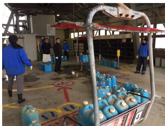
制動試験ウエイト積み込み状況