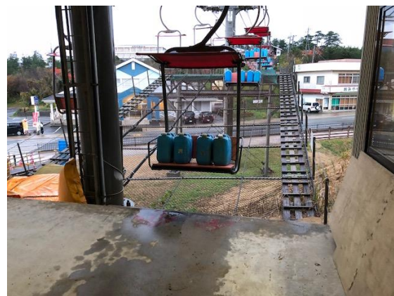
制動試験ウエイト積み込み状況