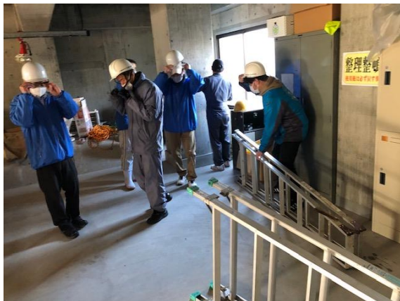
脚立を持って迅速に救助開始