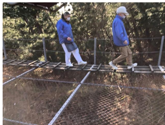
乗客を安全な場所へ誘導する