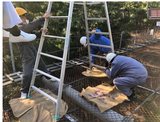
足場を安定させる