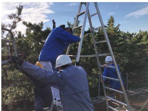
安全に乗客を搬器から降ろす