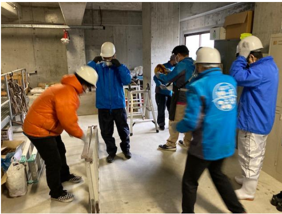
脚立を持って迅速に救助開始