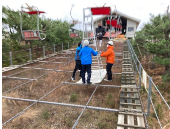
足場を安定させる