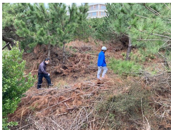
乗客を安全な場所へ誘導する