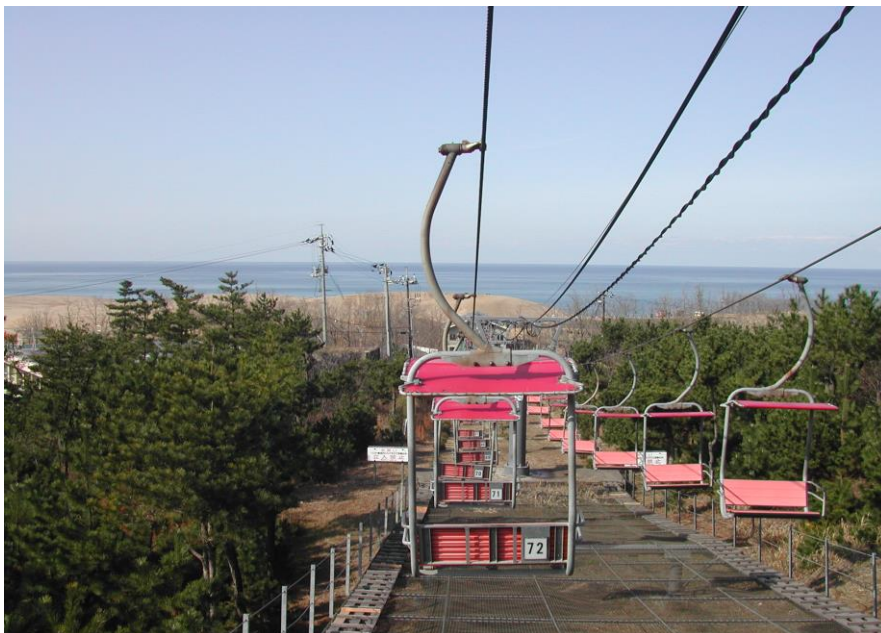
鳥取砂丘観光リフト