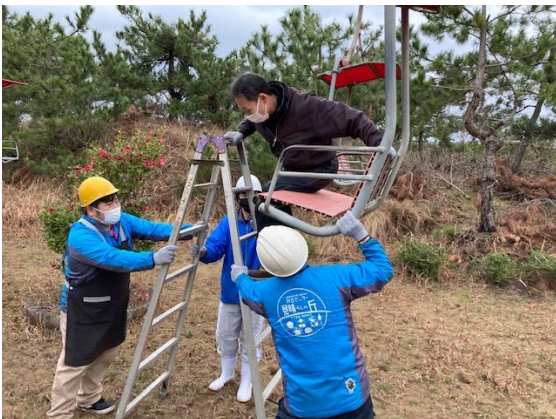
安全に乗客を搬器から降ろす