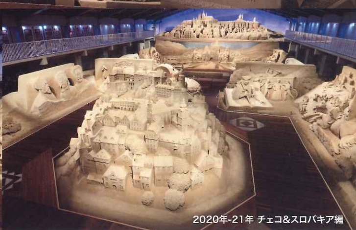
2020年-21年 チェコ&スロバキア編