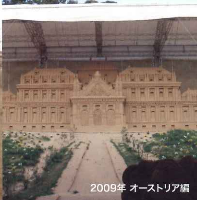
2009年 オーストリア編