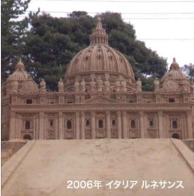
2006年 イタリア ルネサンス