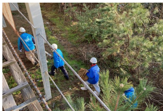
乗客を安全な場所へ誘導する