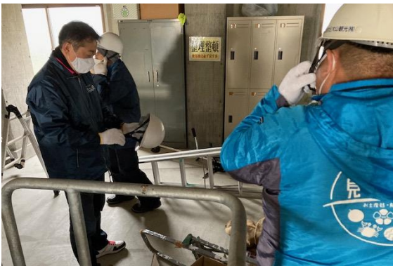
脚立を持って迅速に救助開始