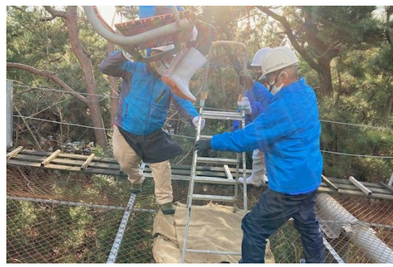
足場を安定させる