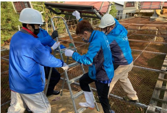
安全に乗客を搬器から降ろす